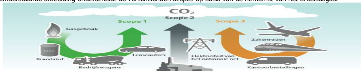
Afbeelding 1: Overzicht CO 2 - scopes

Onderstaande afbeelding onderscheidt de verschillende scopes op basis van de herkomst van het broeikasgas.